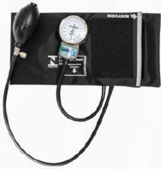
Aparelho de Pressão