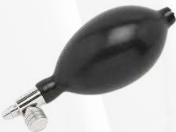
Pera com válvula