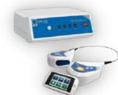
Metalyser e Metamax analisadores de gases de última geração.