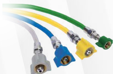
Extensão em nylon