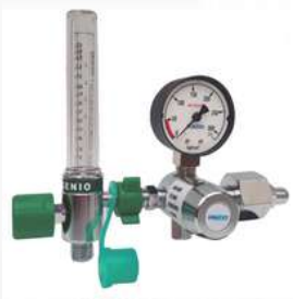
Cilindro com fluxômetro