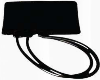
Manguito para Aparelho de Pressão