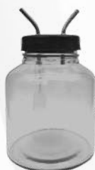
Frasco de aspiração